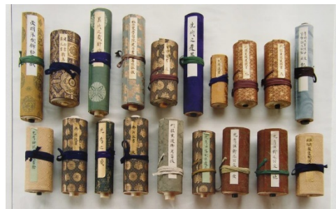
図3 (一部、門脇重綾) 門脇重綾の遺品