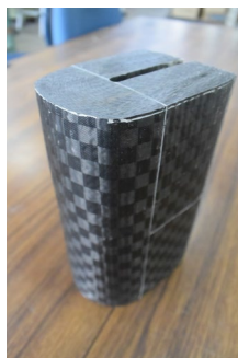
座屈補剛材(ハイブリッド FRP)