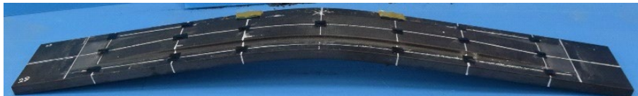
CFRP が接着接合された鋼板の曲げ試験後(CFRP 無しの際の 1.5 倍の曲げ剛性を確認)

高度経済成長期に建設された膨大な鋼構造建築物は経年劣化によって鋼部材が腐食・減肉し, 構造性能が低下している。特に日本の橋梁は 50 年経過橋梁が年々増加しており, 2033 年には日本の橋梁の 67% がこれに相当すると試算されている。しかし, 橋梁を含めたインフラストラクチャーは常に使用者がいるため, 利用を完全に停止し, 再建設を行うことは困難と考えられる。そこでわが国では, これらのインフラストラクチャーを延命化・長寿命化させることが望まれている。本研究では, 軽量・高強度・高耐久性を有する炭素繊維強化プラスチック(CFRP)を既存構造物に接着接合することによって, この延命化・長寿命化の実現を目的としている。