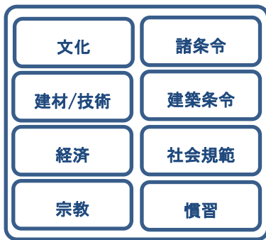
建築を取り巻く要素

建築は様々な要因から成り立ち、街並みを構成します。その要因の一つである法的規制に着目して、中世ドイツ都市の建築条令が当時の街並み形成に展開した過程とその果たした役割について研究しています。しかしながら、法的規制だけで建物や街並みができたわけではなく、当然、様々な諸要因、時代性、地域性が建築には関係してきます。それら史的研究から得られた知見を地域のアイデンティティが醸成されるまちづくりに生かしていきます。