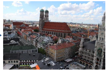
歴史を生かした魅力ある街並み