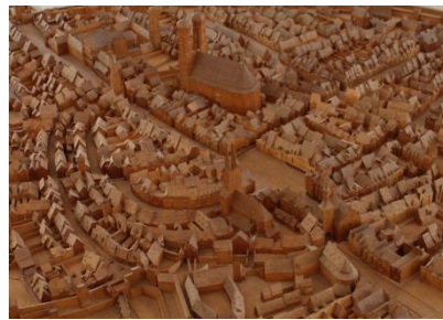
16世紀のミュンヘン(模型)