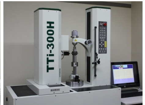
CNC 全自動歯車測定機