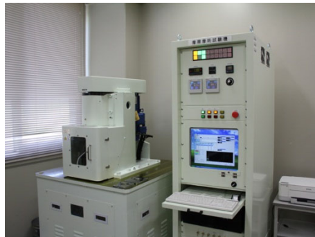
四球式摩擦摩耗試験機