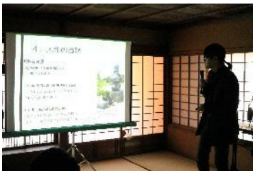
塚と地域文化に関する講演の様子

私の関心は、地域文化の中で真贋を論じることはありません。そうではなくて、いかに複雑に現実もフィクションも織り交ぜられながら地域の中で文化が織られてゆくのか、という点にあります。また、近年ではこうした地理学的研究で培った地域研究のノウハウを生かしながら、災害研究にもかかわっています。