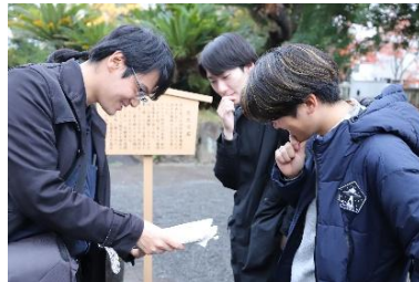
専攻科「現代地理学」フィールド学習