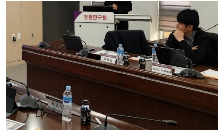
韓国・江原研究院での災害復興に関するセミナー