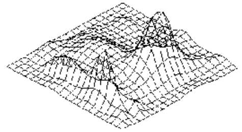
流れの作る気体の形