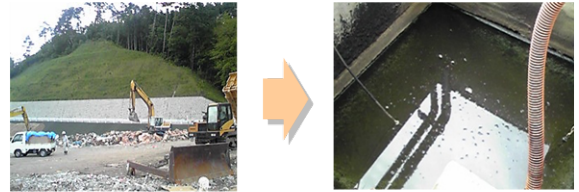
埋め立て地浸出水