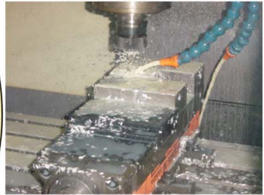
NC・マシニング加工