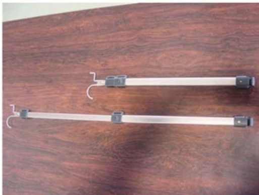
セミナー作品例：自助具の製作