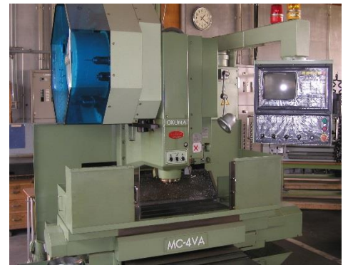
マシニングセンター