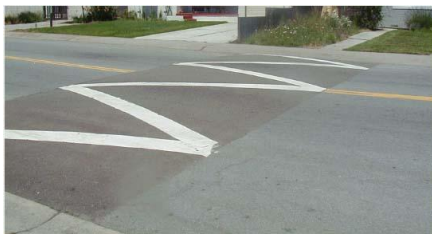
図1. 自動車速度抑制ハンプ

本研究では、従来の固定式(図2の円弧ハンプ・台形ハンプ)と違って、ハンプの高さを制御することにより、車種や速度による速度抑制効果のばらつきや緊急車両への対応を解決することが可能であると考え、“可動式ハンプ”のシステムの提案と研究および試作と実験を行う。可動式ハンプとは、ハンプ手前で車種や速度を認識してハンプの高さを制御するシステムであり、実用化の可能なシステムを構築する(図3)。