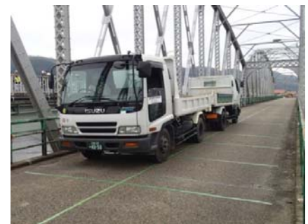
写真-1 実橋載荷試験