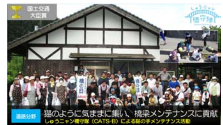
図-2 しゅうニャン橋守隊