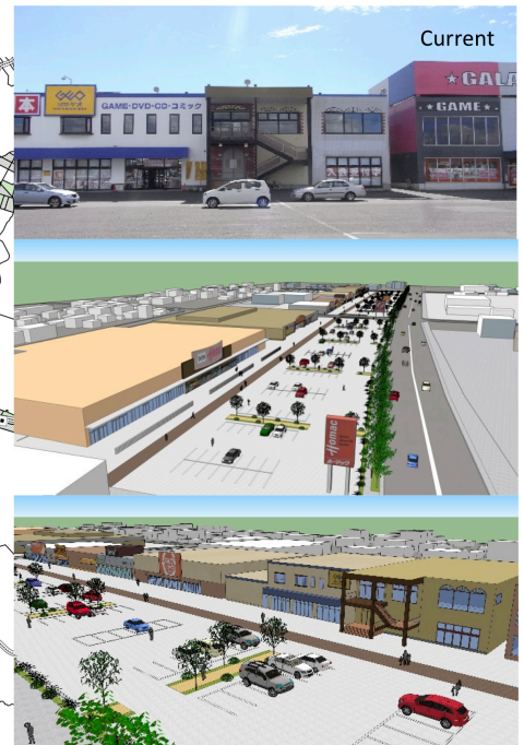
Landscape Planning in Roadside Commercial Area

Land Use , Landscape , Hollowing Out of Central , Aging and Depopulation problem