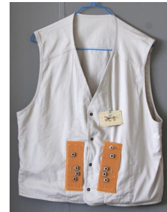
健常者と盲ろう者の会話システム

※ 障害者が利用するシステム・機器は、普通以上に頑健である必要があり、研究室レベルの製作では実用化には耐えられない。研究成果の実用化では、ぜひ企業等との共同開発をお願いしたい。