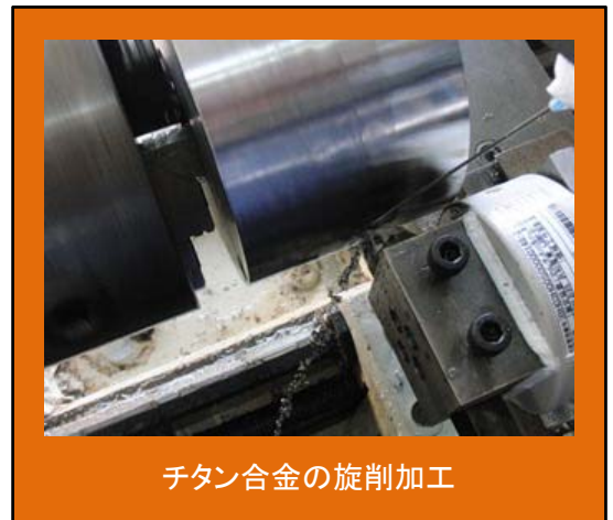
チタン合金の旋削加工

金属加工の分野では、精度良く加工するために加工液を使用することが多い。しかし、この加工液は作業環境に悪影響を与えるばかりか、直接、人体に悪影響を与える可能性さえある。また、複数台の加工機を稼働させている加工現場では、工場全体の電力量の約 4 割を加工液関連が占めているとも言われている。一方で、有機極性物質の一種であるオレイン酸(従来の加工液にも少量含まれていることが多い)を塗布した被削面を切削すると切削抵抗、切削面粗さおよび切りくず厚さが無塗布に比べて大きく減少することが知られている。そこで、このオレイン酸を少量、水道水に混ぜたオレイン酸水を従来の加工液に替え、様々な金属を切削し、その効果を検証する。最終的には、最も効率のよい安全な加工液を目指している。