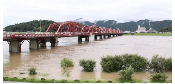
図1 四万十川の洪水時における観測状況

超音波ドップラー多層流向流速計(ADCP)を用いた河川における洪水流況や超音波技術を用いた土砂量計測技術の高精度化に関する研究・開発を行っている。