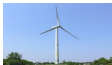
図. 太陽光発電, 風力発電