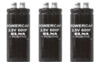
図. 電気二重層キャパシタ

高周波インバータによる電流でコイルより高周波磁界を発生させ、ファラデーの電磁誘導の法則から被加熱物体にうず電流を流す。そのうず電流によってジュール熱が生じ、物体を加熱する。