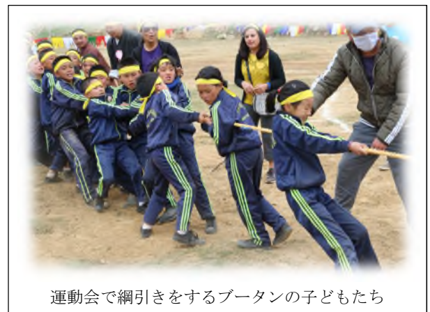
運動会で綱引きをするブータンの子どもたち

1968 年にブータン初の教員養成校である国立教育大学がサムツェに、その後、1975 年に国内2校目となる教員養成校がパロに設置されました。国内では、ブータン人教員を養成するため、教員養成課程の向上・充実に向けた取り組みがなされてきました。しかし、同国における保健体育科は 2000 年に開始されたばかりであり、教員養成についても一部を試行しながら微調整の議論が続いている状況です。また、現職教員の多くは保健体育科教育の受講経験がありません。そのような中で、保健体育科指導法を担う教員のアイデンティティがどのように形成されるに至ったか、またその過程でどのような経験が伴っているのかについて研究しています。