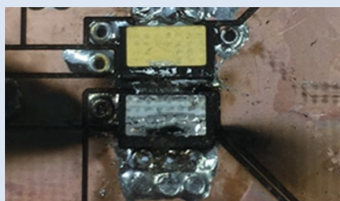
Fig. 2 GaN 誤点弧による熱暴走