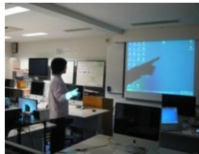
システムを使用の様子