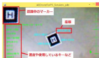
マルチコプター搭載のカメラから見た AR マーカ