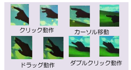
ポインティングの操作の実装