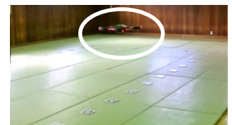
自律飛行中の様子