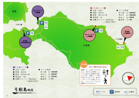
制作したウォーキングマップの一部