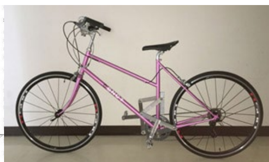
図2 一般用試作3号機のペダリング軌跡と外観