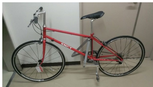
図1 スポーツ用試作3号機のペダリング軌跡と外観

一般用自転車ではビンディングを用いないので、踏み足しか利用することができない。この条件を追加して軌跡評価を行ったところ、縦長楕円軌跡において最も大きな発生動力が得られることが分かった。スポーツ用と同様に四節リンク機構のカプラ曲線で軌跡を近似し、ペダリング機構を設計した。開発した一般用試作3号機を図2に示す。試作3号機では、市販自転車と比較して良好な結果を得ている。