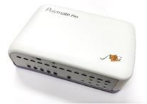
Bio signal recorder