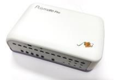
生体信号計測装置