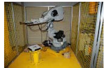
歩行補助具用杖先ゴム耐久試験装置 (産業用ロボット:安川電機)