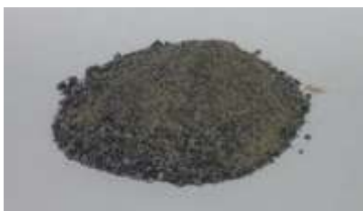
写真1 ごみ溶融スラグ

豊田市では 2007 年から渡刈クリーンセンターが稼働しているが、このクリーンセンターで製造されている溶融スラグを有効利用する場合のデータがないことから、筆者らは数年前から基礎的研究を行っている。研究では、コンクリートの水セメント比および溶融スラグの混入量を変化させて種々の試験を行うとともに、溶融スラグの骨材強度を評価する方法がなかったため、BS812 を応用した破碎試験を実施し、他のクリーンセンターで製造されたごみ溶融スラグと比較を行った。実験結果から、本研究で用いた配合ではスラグ置換率が高くなるに従ってプリーディング率が高くなるが置換率が 50% であっても 4.2% 未満であること、スラグ置換率が 50% までについては大きな圧縮強度の低下を生じないこと、細骨材のスラグ置換率が 50% までならば凍結融解に対して高い抵抗性を有していること、等の知見を得ている。