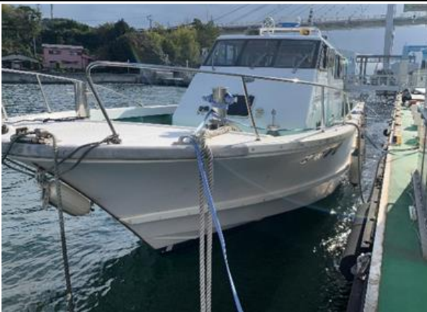
写真 1 実習船はまかせ

その結果、係留索は船体の前後方向、岸壁と反対側にかかる横方向の合計 3 方向の力を支えなければならないということ、ゆえに係留索は 6 本使用し、岸壁から適切な距離を離すことで船体を安定させることができるということを実船を用いて明確にできました(図 1)。また、岸壁との距離を 0m とすると、6 本の係留索に均等に負荷がかかりづらく、偏った係留索の負荷になる可能性が高い。また、各係留索に高い負荷がかかり続けて、長期間の係船には向いていないことも分かりました。