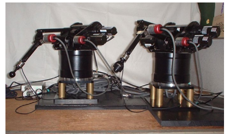
図 2. バイラテラルロボットシステム