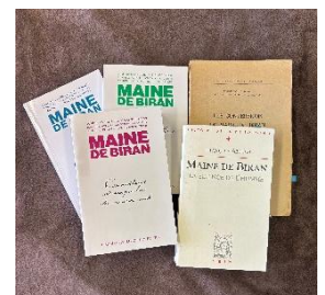
Complete works of Maine de Biran, etc. (right)