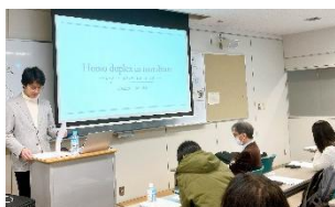
Lecture at Hokkaido Univ. in January 2025.