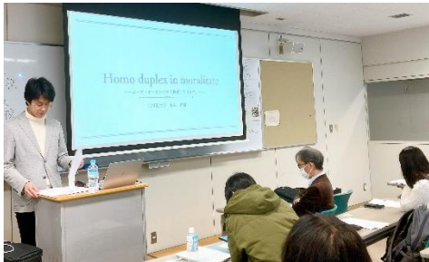
(上)2025 年 1 月北海道大学での講演

ビランの道德論において、「共感」は重要な概念です。なぜなら共感が「私」と他者を関係づけるからです。ただし共感概念は、18 世紀の生理学の影響を受けており、生命原理としての感受性に基づく本能の作用です。このビランの共感を巡る議論について、私はその概念史とアンリとの共通点(あるいは相違点)とを明らかにし、また本能としての共感がいかにして道德的な役割を果たすかを研究しています。