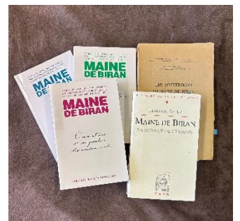
(右)メヌ・ド・ビラン全集と主要な研究書