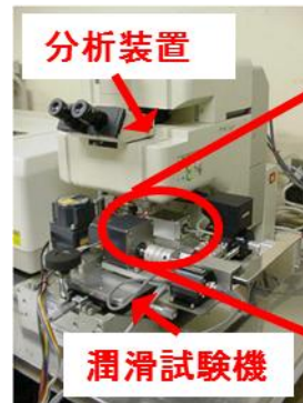
潤滑状態を赤外光で直接見る装置