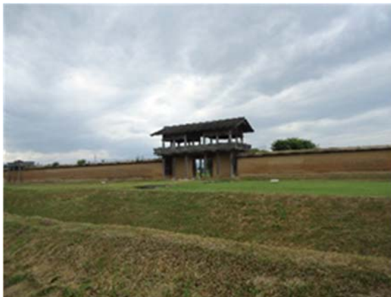
蝦夷支配の拠点の一つ志波城跡

そこで私は、これまで主に文献史料を用いながら、とくに隼人支配がいつ、どのようにして行われ始めるようになったのか、具体的にどのような政策が行われ、いかなる変遷があったのかなどを検証し、さらに蝦夷・南島人支配との比較も行ってきた。その成果はすでに、拙著『律令国家の隼人支配』(同成社、2017年)でまとめた。現在は、そこで論じ尽くすことができなかった部分のさらなる検証を行い、上記した論点の解明を進めている。