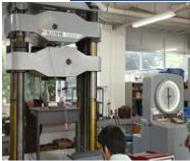
Universal Testing Machine