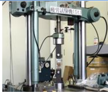
Fatigue Testing Machine