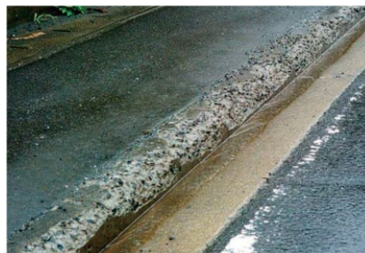
Fig.2 Salt Scaling of Concrete due to the Influence of the Deicing chemicals