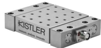
切削動力計による 切削力の測定