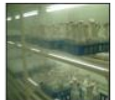
エリンギ栽培状況