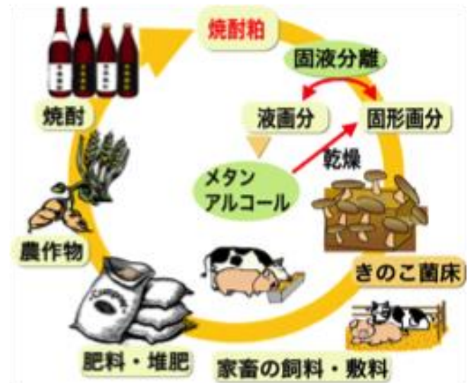
焼酎粕の新規の資源循環システム