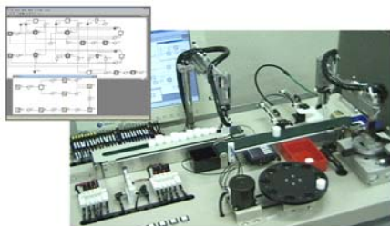
離散事象システムモデルに基づくシーケンス制御系設計支援

本研究では、離散事象システム理論に基づいてシステムの設計・解析・制御などに関わる問題の解決を図っております。例えば、シーケンス制御に用いられている PLC (Programmable Logic Controller) ではラダー図が多く使われていますが、そのプログラムの作成には未だ熟練した専門家の経験に負うところが大きいのが現状です。そこで、そのようなシーケンス制御系の設計をサポートする方法の開発をしています。また、プロジェクト管理などに用いられている CPM (Critical Path Method) では作業時間のばらつきに関する情報をもったまま適用することはできません。そこで、作業時間のばらつき、さらには作業順序の変化にも対応した CPM の拡張を考えています。