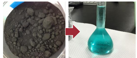
キレート洗浄で鉱滓から抽出した銅