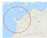
GPS-RTKモジュールと高精度測位可能範囲