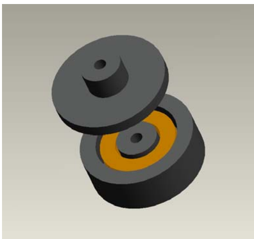
図1. 円筒電磁石の形状解析

一方, 図2は, 二次元電磁界解析モデルの一部であり, 一般配電系統に用いられる力率測定用の電流電圧一体型センサの電圧センサ電極配置位置ならびに電極形状決定に関する解析モデルである。本モデルは, 電圧センサ電極形状を変化させて解析を行うため, 解析ソフトウェアは, 本解析に対応した電磁界解析プログラムを作成している。