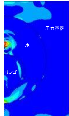
図3 衝撃波の伝播シミュレーション