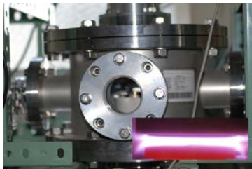
低真空型RF放電プラズマCVD装置と内部の放電プラズマ状態