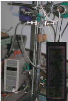
光触媒粒子充填層型オゾン生成器と内部の放電プラズマ状態

電極間にガラス等の誘電体を介在させ、ヘリウム等のガスを用いて放電を行うと、熱的非平衡状態が保たれた低温プラズマが形成できる。これをジェット状に形成することによって、任意の場所にプラズマを照射することが可能となり、医療等への応用も期待できる。本研究では、特に同軸二重管構造の大気圧プラズマに着目し、その基礎特性を明らかにする。