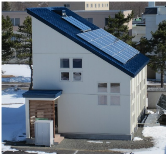
未来型実験ハウス

北海道のような寒冷地では冬季のエネルギー消費が膨大であり、それに伴い大量のCO 2 を発生している。この問題を解決するために苫小牧高専敷地内にエネルギーシステム最適化評価施設(未来型エネルギーハウス)を建設した。本施設は延べ床面積 124m 2 であり一般住宅を模擬しているが、太陽光発電, 太陽光集熱器, 燃料電池, ヒートポンプなどの新エネルギー機器を有している。世帯構成の違いによる負荷パターン別にエネルギー消費が最小となるような新エネルギー機器の組み合わせを明らかにするほか、再生可能エネルギーである太陽光を最大限利用しているため地域の気象条件も考慮した最適運転制御手法を開発する。また、蓄電・蓄熱装置を組み合わせ、それらの最適設備容量を明らかにし、熱負荷が高い寒冷地においてネットゼロエネルギーシステムの構築を目指す。