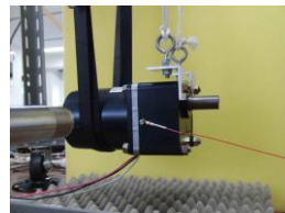
Gear motor sound design