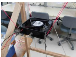
Axial flow fan sound design