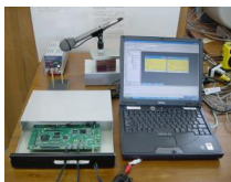
Acoustic diagnostic device