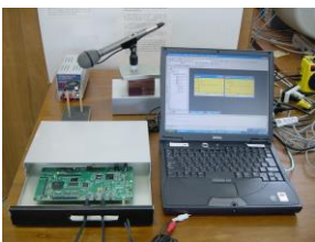
図1 適応フィルタを用いた診断

人には聞こえづらい低周波数の音を用いた音響式体積計の開発を行なっている。この応用として、庄内特産のイワガキやエゾムラサキウニの体積を測定することで身入りが推定できないか検証実験を行なっている。