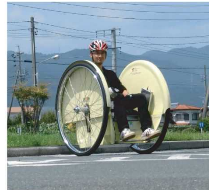
図2 着座式二輪ビークルの外観