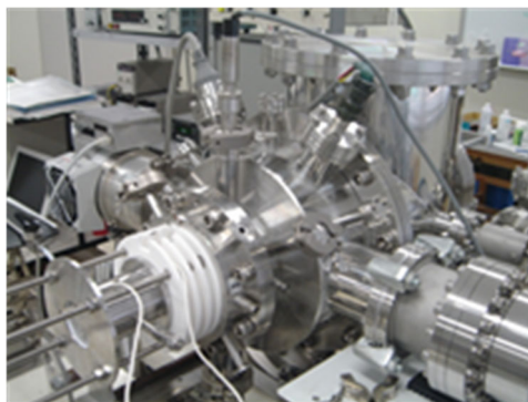
図1 大気圧イオン化質量分析装置

大気圧イオン化質量分析装置(図1)を用いてコロナ放電や大気圧プラズマによって発生するイオンの質量スペクトルの測定を行い、イオン種の同定およびイオン生成反応の解析・モデル化を行っています。図2はイオンの質量分析の結果から推定した空気中のコロナ放電で生成した負イオンの反応モデルです。そのほかにも、大気圧化学イオン化を利用した大気微量成分の分析法や、イオン移動度分析法を用いたナノサイズ微粒子の計測法の開発も進めています。