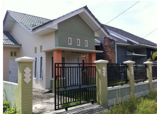
図1 インドネシアで一般的に普及している住宅

東南アジアにおいて、現地の経済的・技術的・環境的実現性を考慮した環境配慮型建物の普及を研究するに当たり、初期段階として、現地技術者の技能レベルや住宅購買層の経済的状況や環境意識を把握する必要がある。そこで現在は、共同研究実施機関であるインドネシア・アンダラス大学の研究者に協力をいただき、パダン市における室内環境に関する意識調査を行っている。