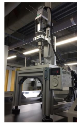
ソフトマテリアルリング用の摩擦測定装置開発

CAD, 3Dプリンター, レーザー加工, 3Dスキャナー等の先端技術を用いて造形される構造体のデザイン。