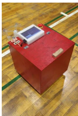
白線引きロボット