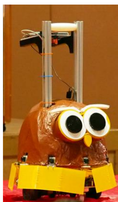
学校案内ロボット