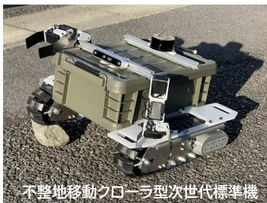
不整地移動クローラ型次世代標準機