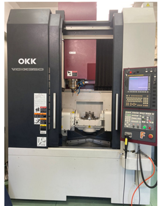
5 軸制御マシニングセンタの外観