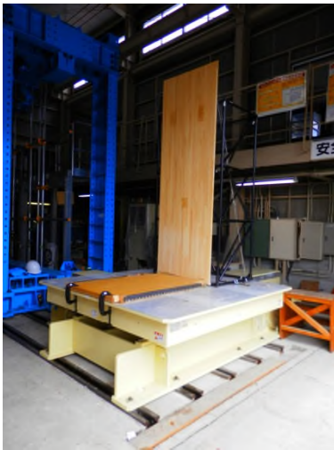
水平2次元地震波振動台 SPT2D-20K-85L-50T 地震波最大能力線図

この装置で振動台を加振すると、東日本大震災で得られた長周期成分を多く含む地震動波形を下図に示す性能線図以内の範囲で、ほぼ正確に再現できるために、実物大の家具等の転倒実験や縮小した建物等の2次元長周期地震動による振動台実験が可能になる。また、現存する振動台加振装置と同時に稼働させることで、2次元の地震動の加振が可能になり、部屋の中の家具や物品などの挙動をより正確に再現させることができるために、地震時の転倒や移動を防止する器具などの開発に寄与できる。