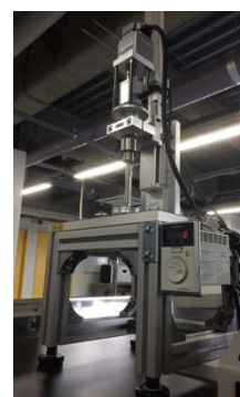
Friction measuring device for soft material ring

Design of structures to be molded by advanced technologies such as CAD, 3D printing, laser processing, 3D scanning.