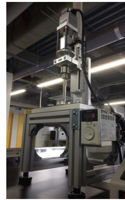
ソフトマテリアルリング専用 摩擦測定装置開発

CAD, 3Dプリンター, レーザー加工, 3Dスキャナー等の先端技術を用いて造形される構造体のデザイン。