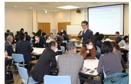
写真. 住民や学校教員向けのワークショップ